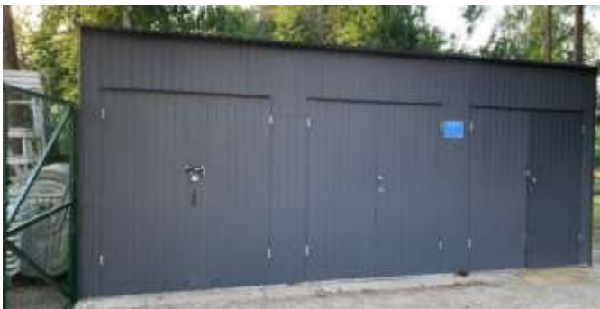
5,52 тис. грн/кв.м