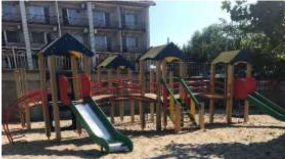
Фото з «Інтернет» ресурсів та їх вартість

Фактично придбано Ціна за одиницю – 201,60 тис. грн